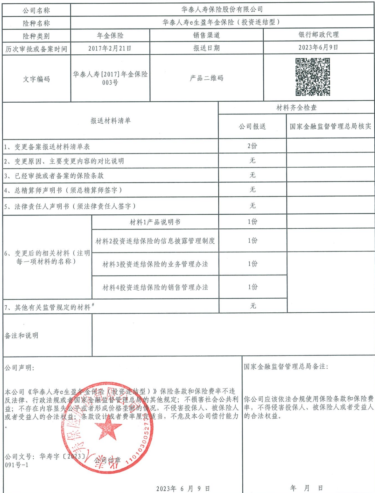
变更备案报送材料清单表