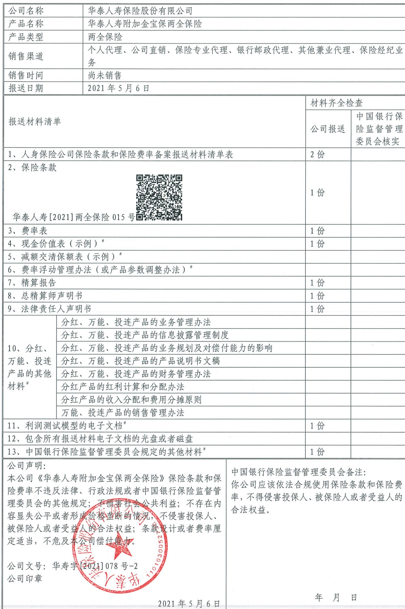
人身保险公司保险条款和保险费率备案报送材料清单表